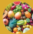
Frutta a scelta