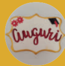
Targhette di zucchero e personalizzate