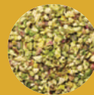
Granella di pistacchio o nocciola